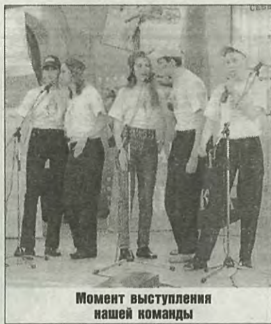
Момент выступления нашей команды

Церемония награждения пролетела очень быстро, тем не менее, и это было ещё не всё. Для стипендиатов организовали грандиозный банкет. Можно было потанцевать под любимую музыку, пообщаться со студентами из других вузов и, конечно, просто отдохнуть в весёлой