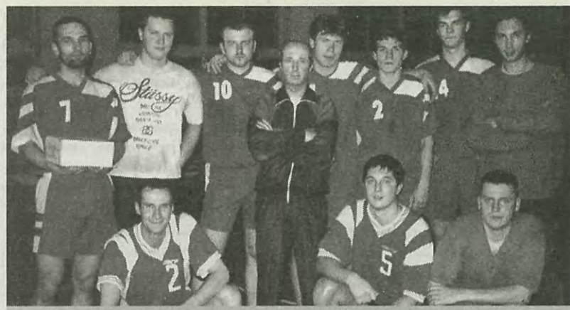
Команда победителей — сборная СПбГТУ, выпускники Политеха

Блестящая плеяда выпускников, ставших символами отечественной и мировой науки ушедшего века, в том числе выпускники ППИ-ЛПИ — П.Л. Капица, Ю.Б. Харитон, М.И. Кошкин, преподава-