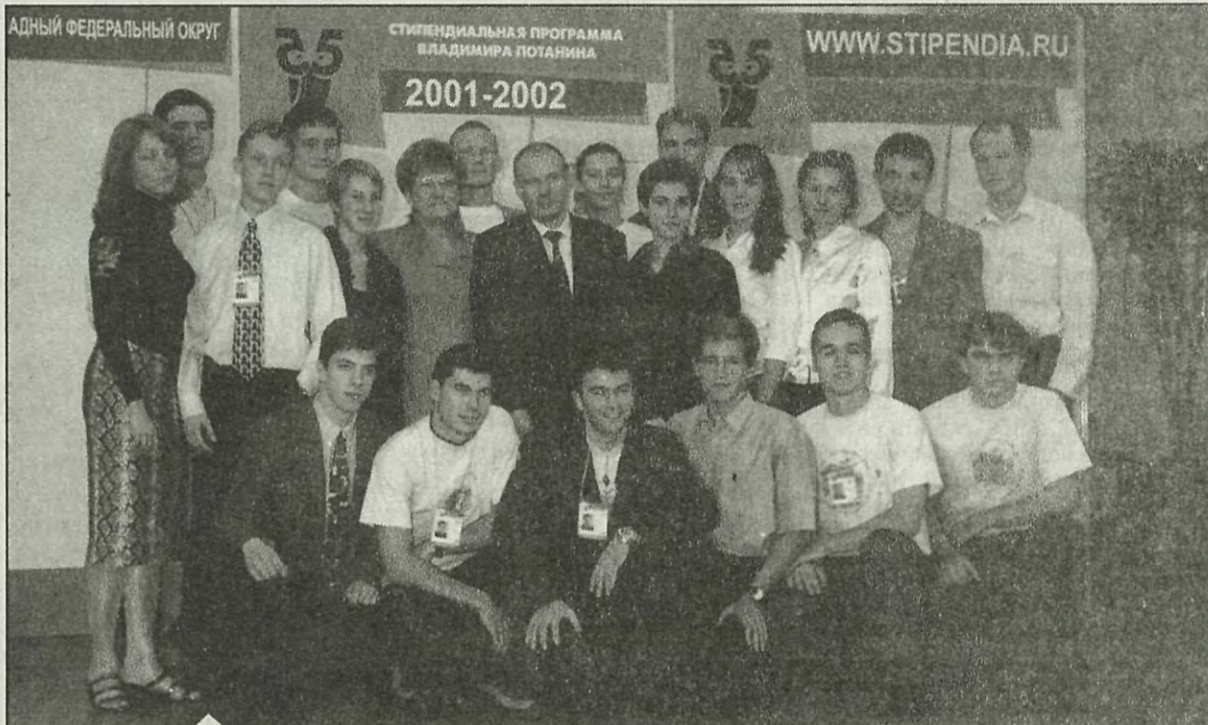
Стипендиаты Санкт-Петербургского государственного технического университета