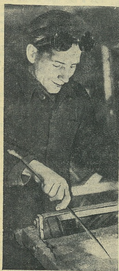
Старший сержант запаса

Собрание заканчивается здравницами в честь большевистской партии, в честь товарища Сталина, в честь нерушимого блока коммунистов и беспартийных.