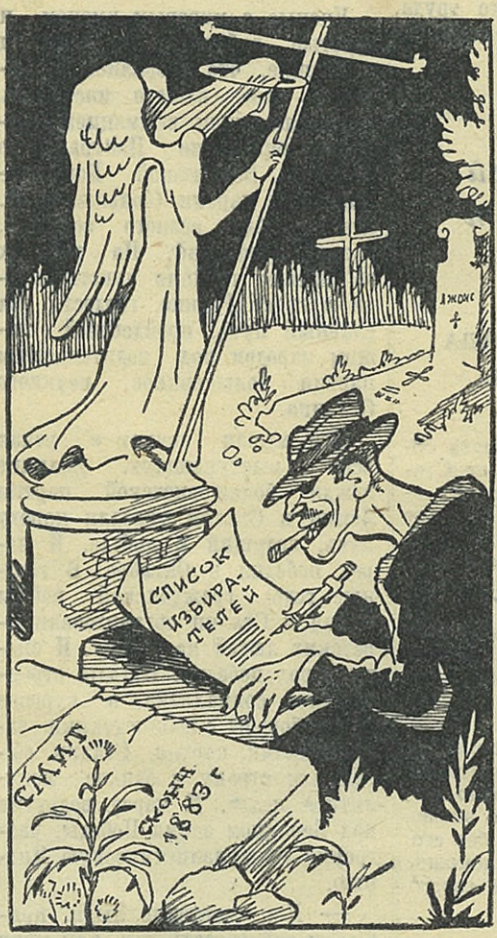
— Хелло, Смит! Вы согласны отдать свой голос?.. (Гробовое молчание). Молчите? Принимаем ваше молчание за знак согласия.

Таковы некоторые черты «долларовой демократии», которую американские империалисты стремятся насильно навязать всему миру. Однако на этом пути они встречают решительный отпор со стороны сил демократии и прогресса, которые растут и крепнут во всех странах, в том числе и в самой Америке.