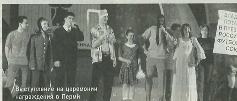
Выступление на церемонии награждения в Перми

не обошлось без помарок, но идеальных выступлений не бывает.