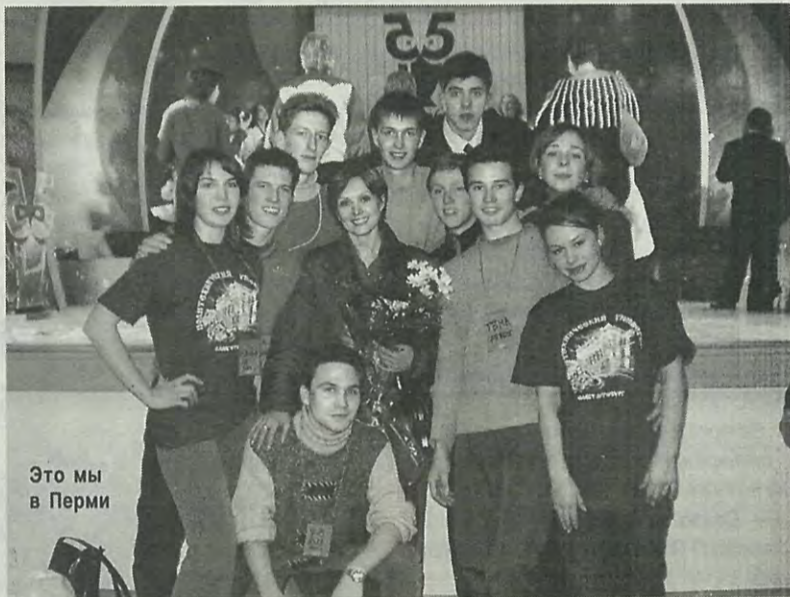
Это мы в Перми