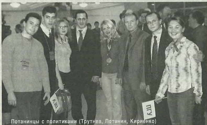
Потанинцы с политиками (Трутнев, Потанин, Кириенко)

Апогей настал 21 ноября, утром. В этот день мы выступали. Буквально за 20 минут до выступления режиссеры поменяли нам шутку в сценарии, но выступили мы нормально. Всем было смешно. Конечно,