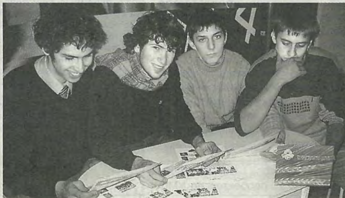
Они ищут работу

Т ри дня длилась в нашем вузе ярмарка вакансий для студентов и выпускников инженерных факультетов. Утверждать, что все остались довольны, не берусь, но у студентов, уверена, была реальная возможность оценить свои перспективы и самоопределиваться.