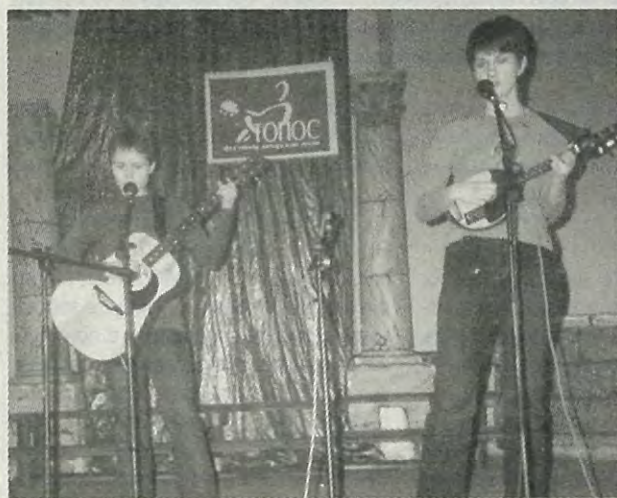
Обладатели гран-при «Розенкранц и Гильденстерн»

Как всегда, ноябрь передает первому зимнему месяцу эстафету - фестиваль авторской песни ТОПОС. В нашем клубе с 3 по 5 декабря прошел XXXIV городской фестиваль авторской песни. Следующий ТОПОС будет юбилейным - ТРИДЦАТЬ ПЯТЫМ.