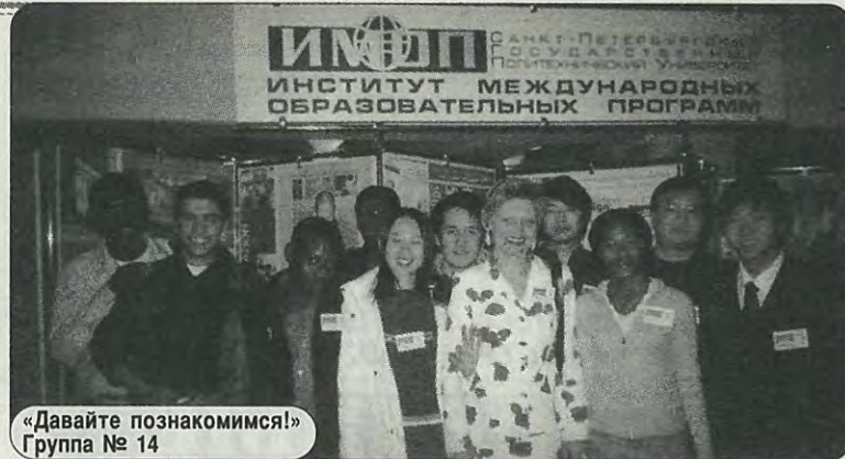
«Давайте познакомимся!» Группа № 14

Преподаватели русского языка работали в учебных заведениях различных стран Европы, Азии, Африки, Латинской Америки. Кафедра принимала на стажировку преподавателей русского языка из вузов Вьетнама, Кубы, Китая, ФРГ, Финляндии, Чехии, Польши, Венгрии и других стран. Иностранные студенты приезжают в Россию с большим желанием не только