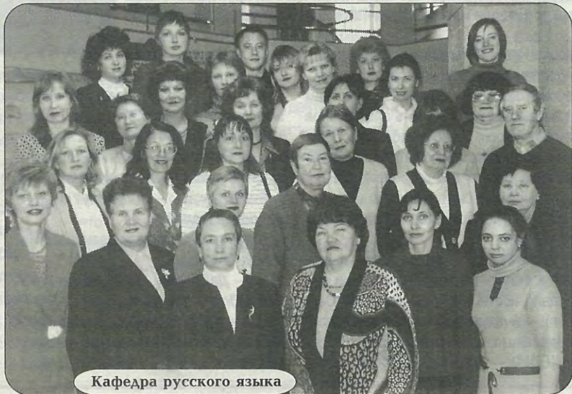
Кафедра русского языка

На свете много кафедр славных, Но наша нам всего милей, В судьбе ты нашей стала главной, И нет для нас тебя родней.