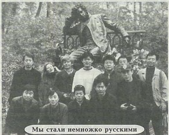
Мы стали немножко русскими