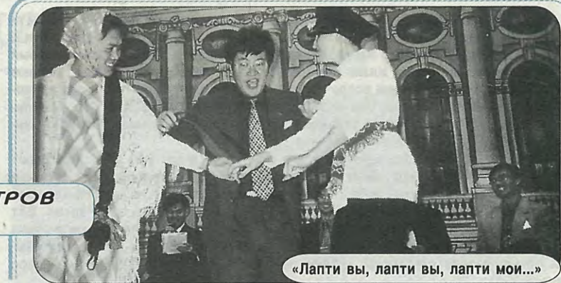
«Лапти вы, лапти вы, лапти мои...»

Активно участвуют иностранные студенты и в творческой жизни нашего института. Это и участие в работе международного клуба «Странник», и посещение «Вечеров в Политехническом», и выступления на фестивалях «Золотая осень» и «Белые ночи».