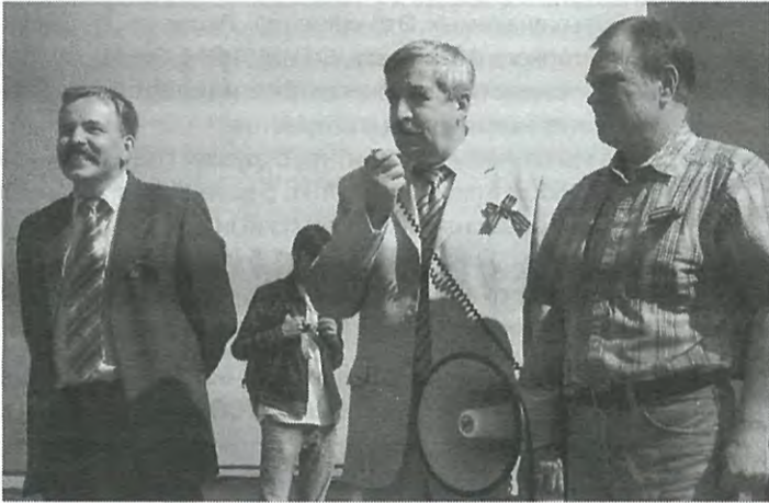
Инструктор перед стартом