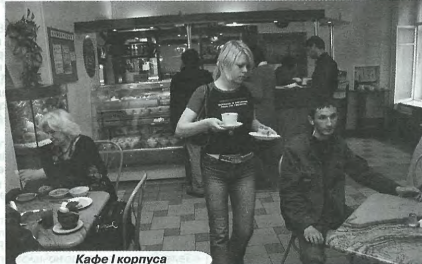
Кафе 1 корпуса