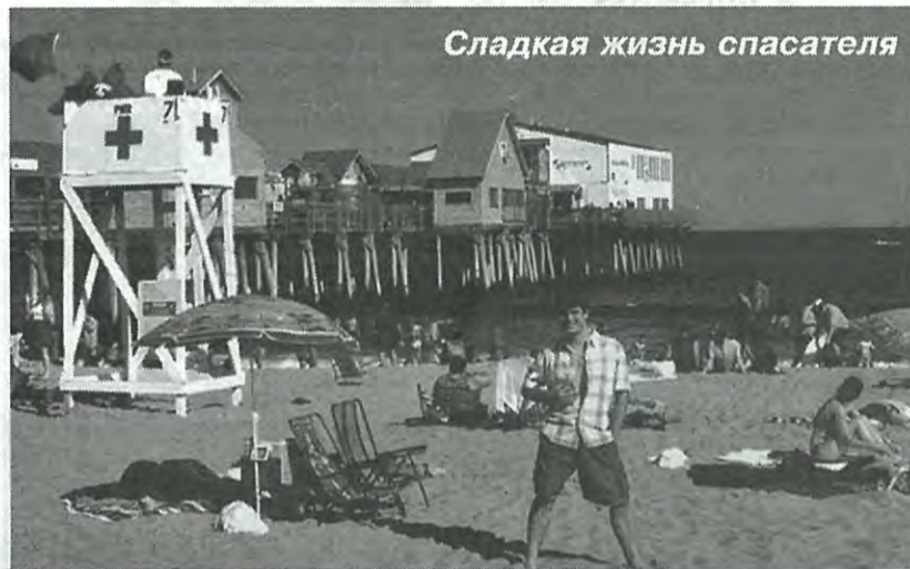
Сладкая жизнь спасателя