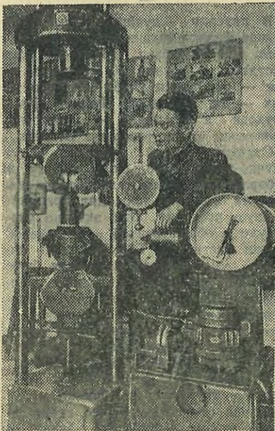
В лаборатории металловедения. Настройка прессы