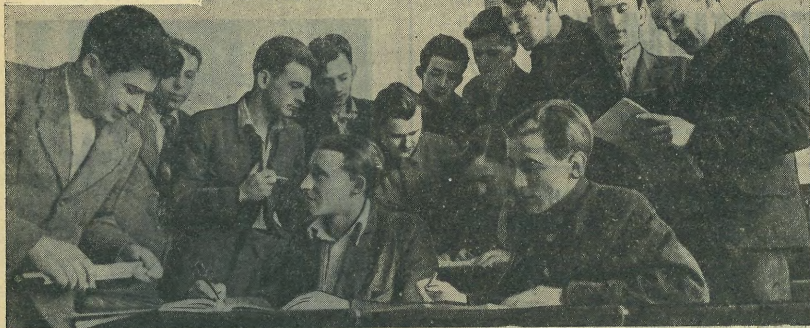
Лекция окончилась. Студенты 230-й группы обмениваются впечатлениями о новом материале