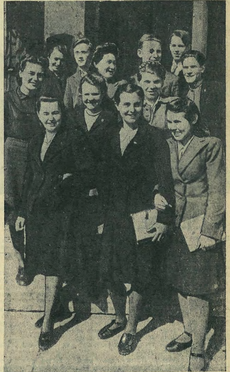
Эти девушки и юноши учатся в нашем институте первый год. Но дружный и спаянный коллектив уже добился больших успехов в учебе. Их группа завоевала звание лучшей на первом курсе. Ниже мы рассказываем о том, как работает эта группа