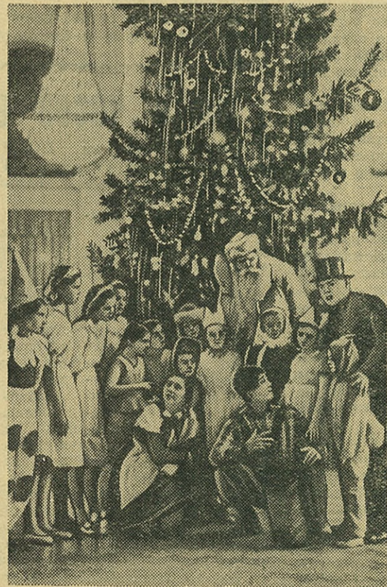
Весело начали свои каникулы школьники. Для детей рабочих, служащих и преподавателей нашего института Дом ученых в Лесном устроил новогодний праздник ёлки.

В борьбе за переходящее Красное знамя многие стро-