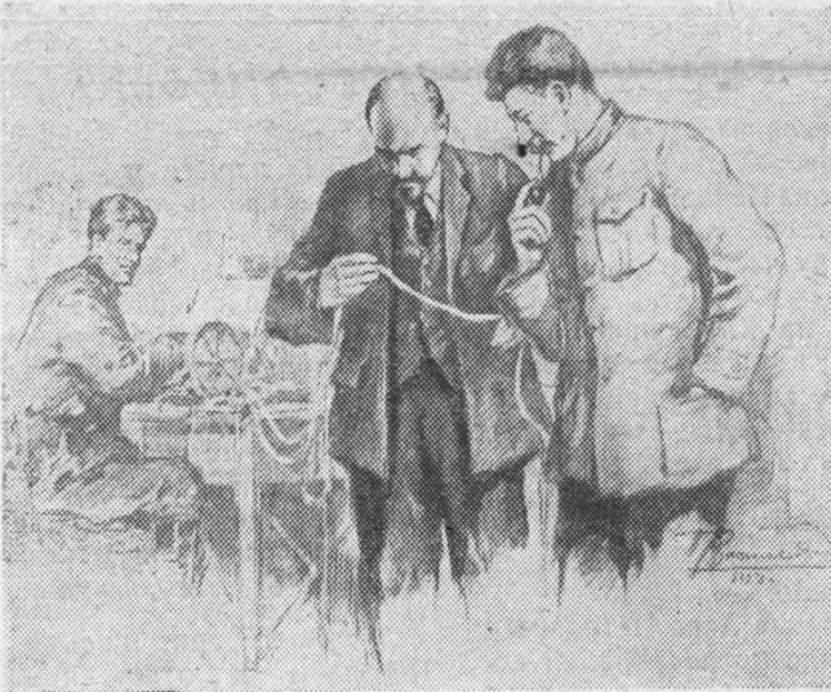
В. И. Ленин и И. В. Сталин у прямого провода. Рисунок художника П. Васильева. (Центральный музей В. И. Ленина)