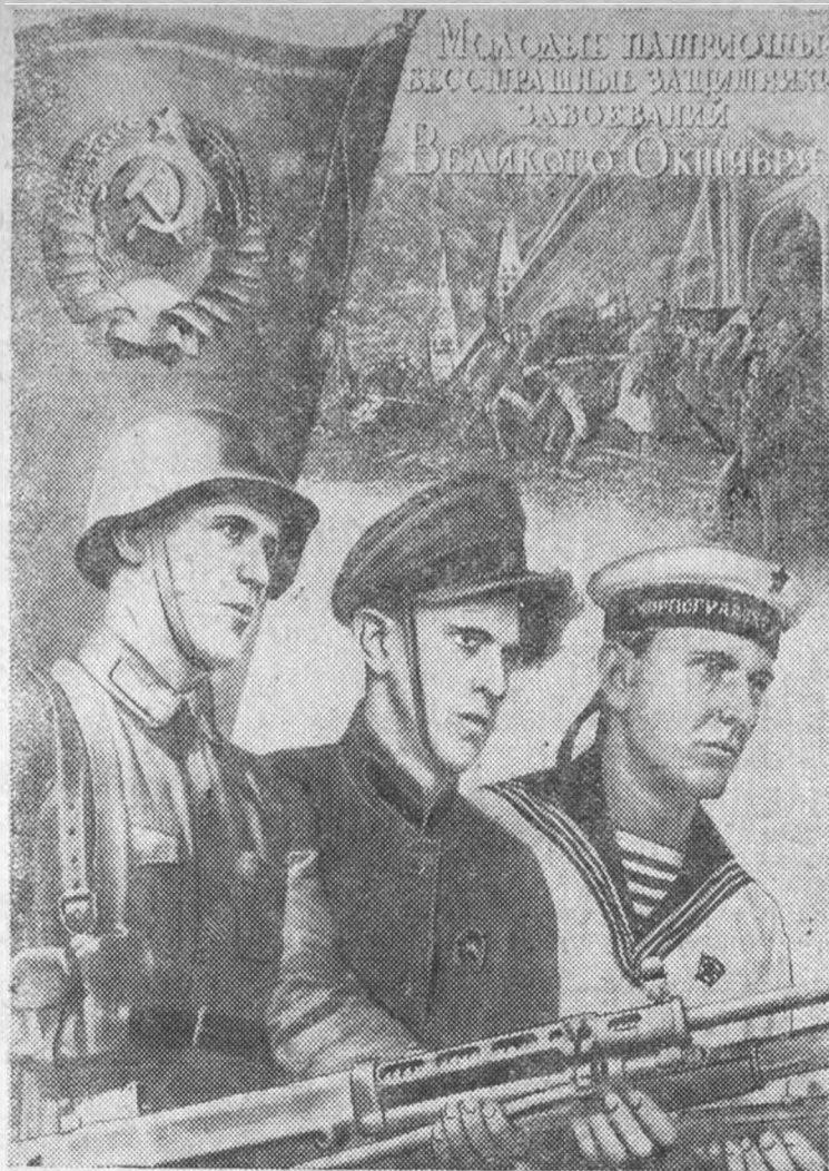
Плакат художника А. Губина, выпущенный ростовским отделением Союзфото