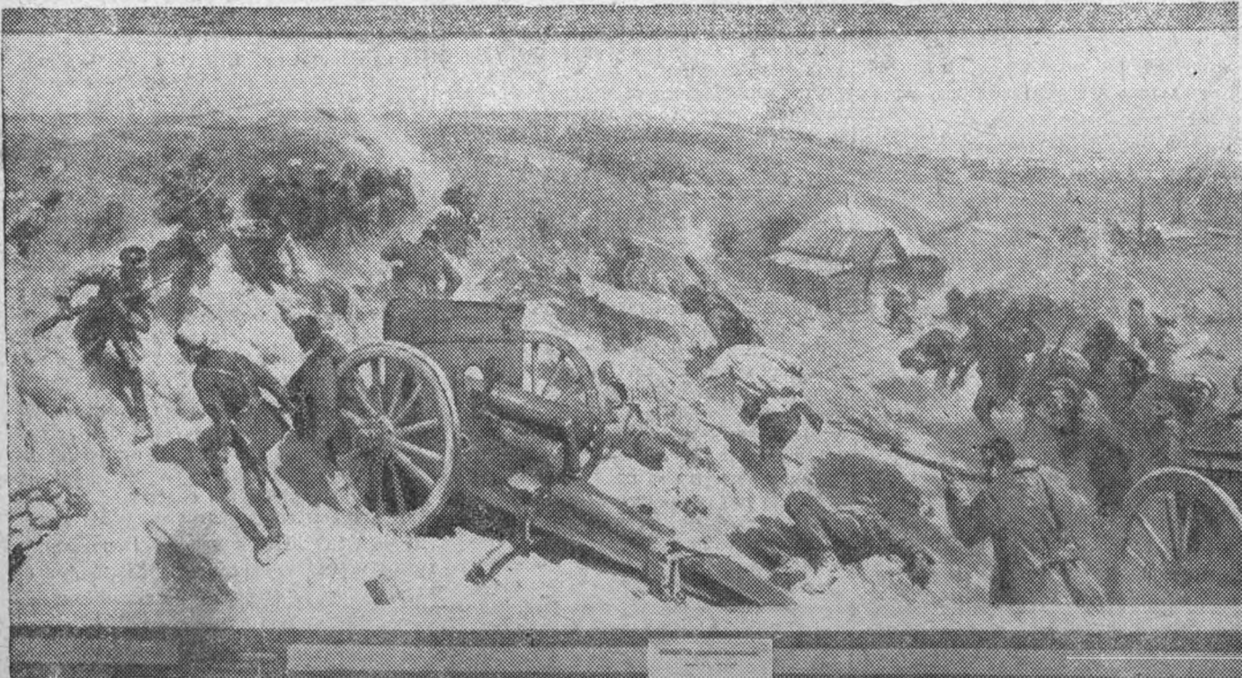
„Оборона Царицына“. Картина художника Грекова