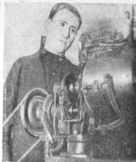
Машиностроительный завод имени Энгельса за вторую пятилетку освоил ряд новых машин для обувной и текстильной промышленности