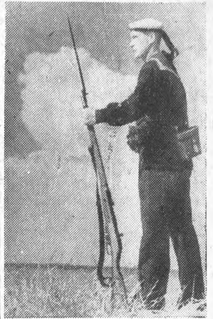
На охране северо-западных границ СССР