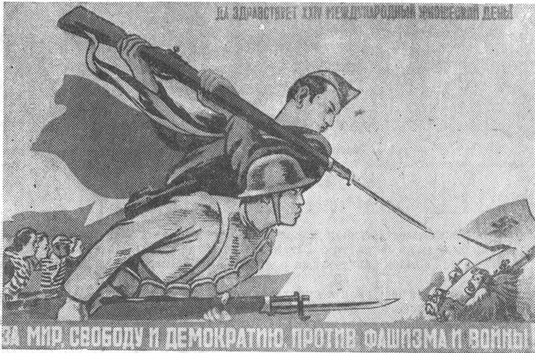
Плакат к XXIV Международному юношескому дню, работы худ. О. Прокопова, выпущенный издательством 'Искусство'.

7 человек из вновь принятых — члены ВКП(б), 816 — комсомольцы. Женщины составляют 17,6 проц. к общему количеству новичков.