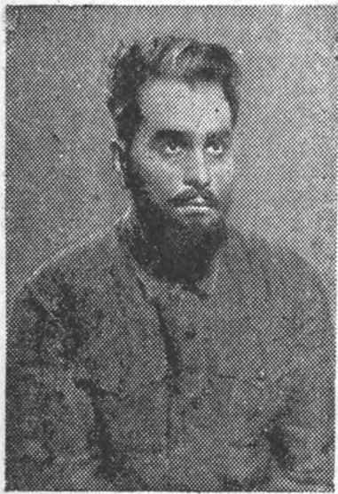
В Государственном академическом театре Оперы и Балета им. С. М. Кирова будет показана новая советская опера „Щорс“, либретто Спасского; музыка композитора Г. К. Фарди, постановка заслуженного деятеля искусств П. М. Журавленко и режиссера Я. А. Милешко, декорации художника А. И. Константиновского, дирижирует спектаклем С. Б. Ельцин.