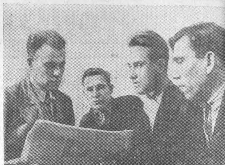
В Доме партийного просвещения им. С. М. Кирова Ленинградского Горкома и Обкома ВКП(б) в гор. Пушкин проходят теоретическую подготовку пропагандисты и руководители партийных организаций Ленинграда и области