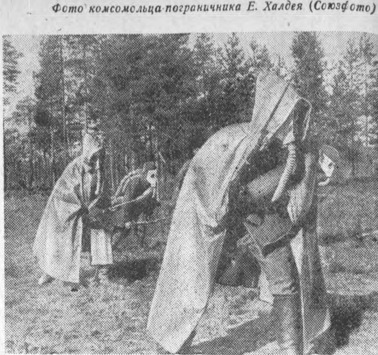
Боевая и политическая подготовка пограничников Н-ской части (Северо-Западная граница СССР). На снимке—пограничники на занятиях по преодолению „участка заражения“.