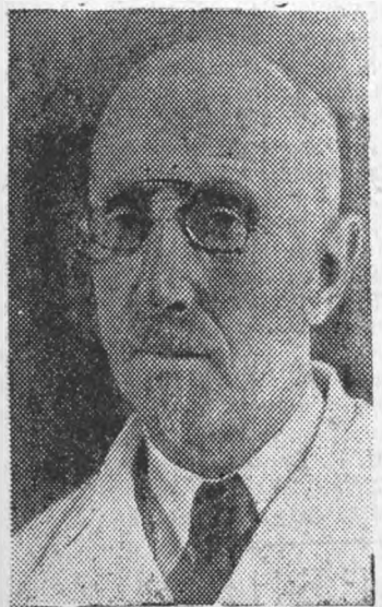
Недавно закончилась международная противораковая неделя.