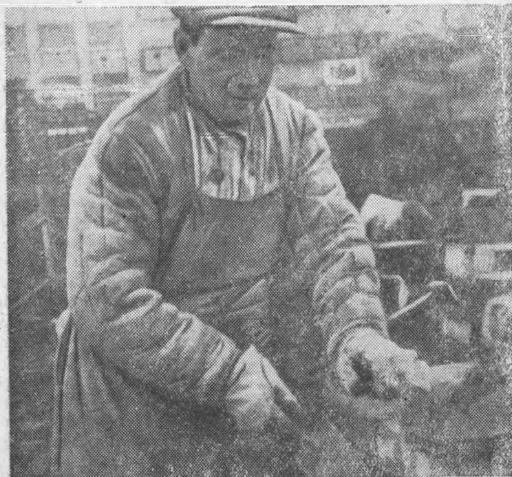
Механизированная подача кирпича на строительстве яслей