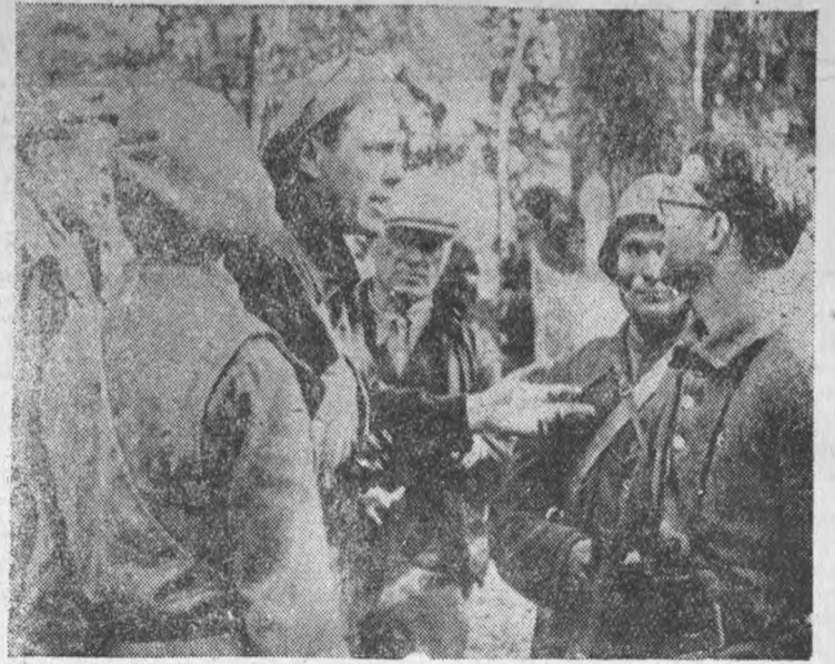
Совещание командиров Интернациональной бригады правительственных войск на Мадридском фронте