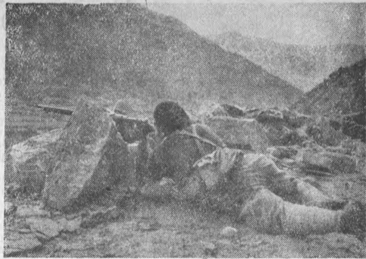
Боец батальона альпинистов правительственных войск на посту в горах на Арагонском фронте (СФ)