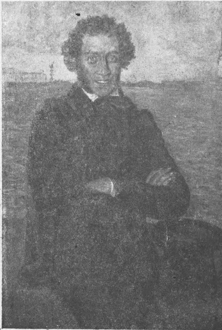
Ленинградский Областной Союз художников организовал конкурс на лучшее художественное произведение, посвященное 100-летию со дня смерти А. С. Пушкина.