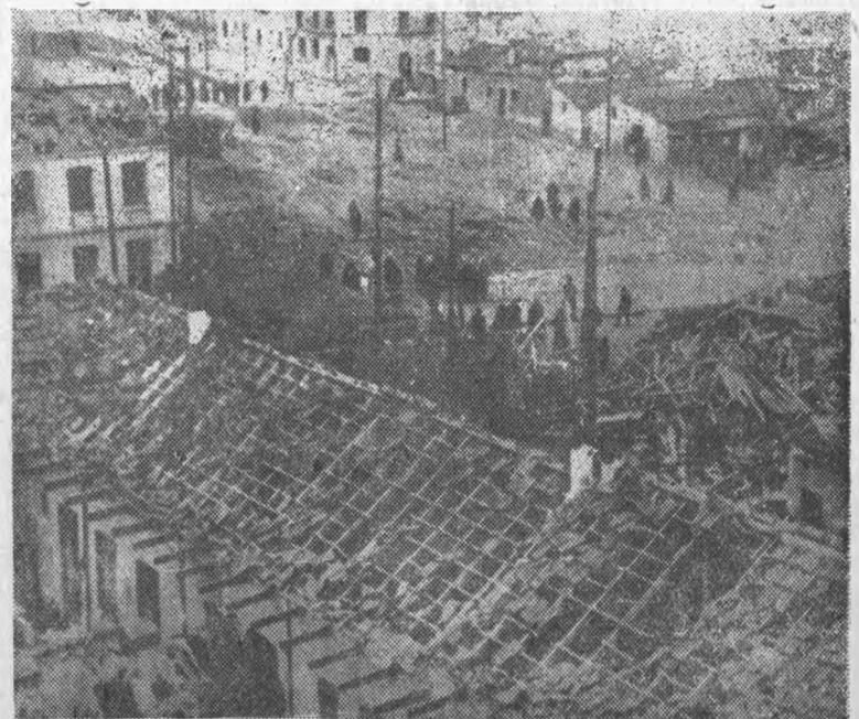
Разрушенные бомбами фашистской авиации дома в предместьях Мадрида