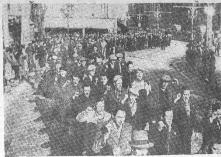
Бойцы интернациональной колонны правительственных войск с пенсией „Интернационала“ демонстрируют на улицах Барселоны

Год издания третий АДРЕС РЕДАКЦИИ: Ленинград, Сосновка, 1/3, Индустриальный Институт. 1 корп., комн. 48—48 № 13 (254) ПОНЕДЕЛЬНИК, 8 февраля 1937 г.