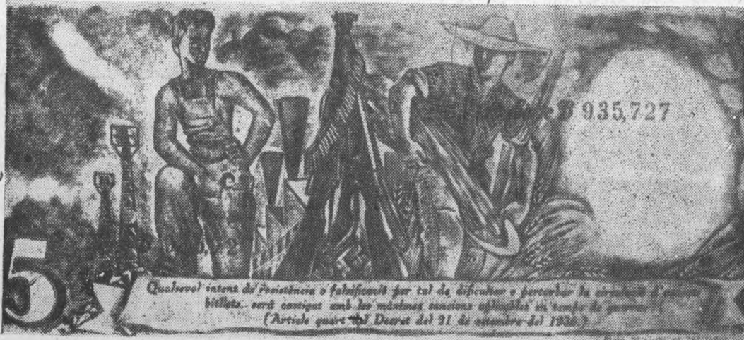
Новый кредитный билет в 5 пезет, выпущенный Каталонским правительством 10 декабря 1936 г. Слева—изображение рабочего, справа—крестьянки, в центре—три винтовки и пулеметная лента