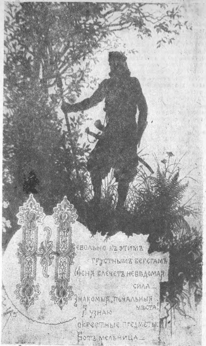
Иллюстрация к поэме „Русалка“ (Рис. худ. Гельмерсона)