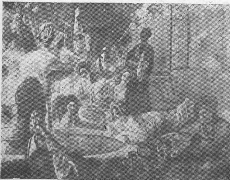
Гарем хана—рис. худ. Штейна („Бахчисарайский фонтан“)