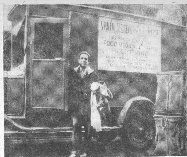
Один из грузовиков, собирающий в Нью-Йорке продовольствие, одежду и медикаменты для республиканской Испании. Надпись: „Испания нуждается в нашей помощи. Этот грузовик собирает продовольствие, медикаменты и одежду. Северо-Американский комитет помощи испанской демократии“.