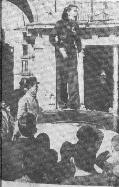
Выступление оратора агитколонны мадридской молодежи на одной из мадридских улиц.