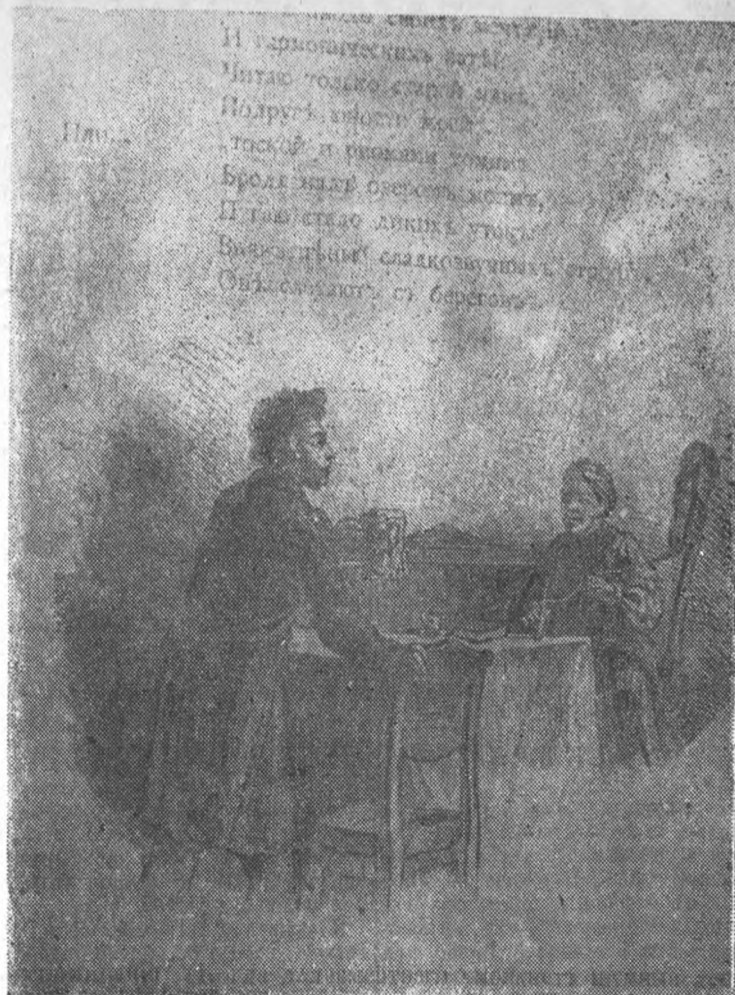
„Пушкин и няня“