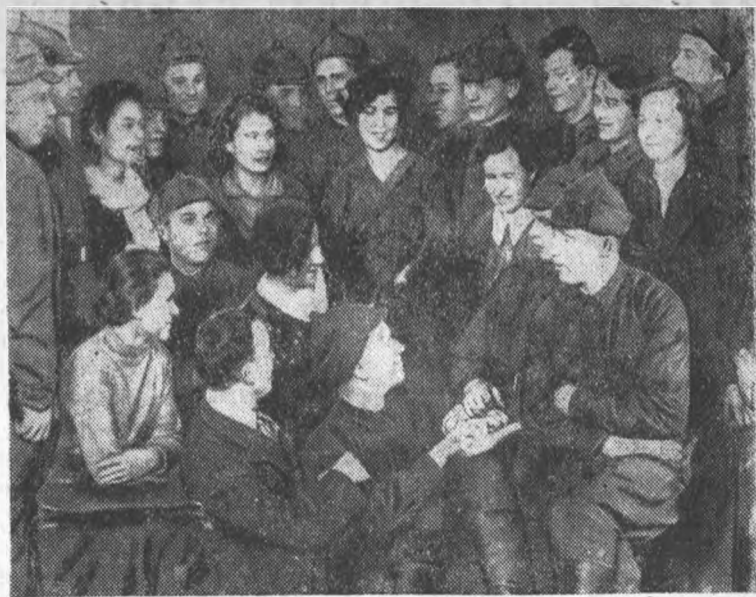
Пограничники подшефного отряда в гостях у комсомольцев ЛИИ