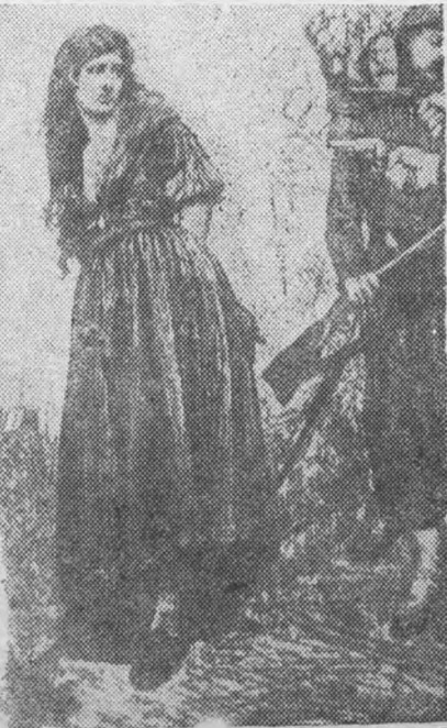
Расстрел „поджигательницы“. (Рис. из журнала 1871 г.)