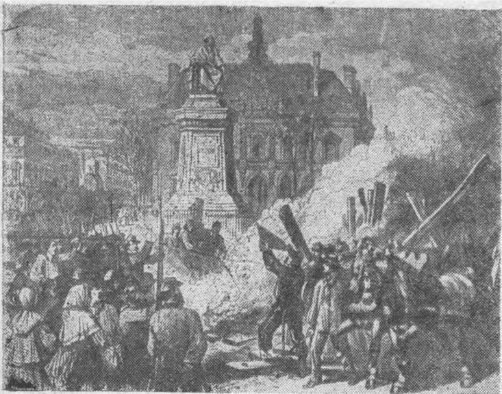
Сожжение гильотины. (Рис. из английского журнала 1871 г.)