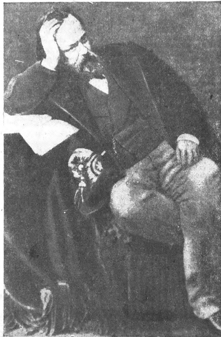
Портрет А. И. ГЕРЦЕНА с фотографии Левицкого 1861 г. (по материалам Государственной Публичной Библиотеки им. Салтыкова-Щедрина)