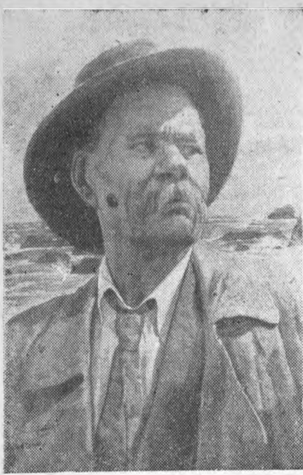
Портрет А. М. Горького, работы заслуженного деятеля искусств И. И. Бродского