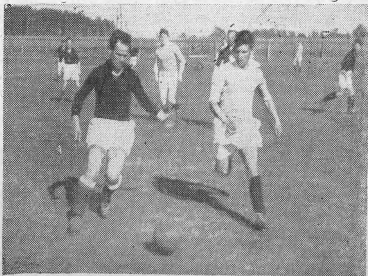
Момент игры команд механического и энергомашиностроительного факультетов в финале первенства ЛИИ по футболу

В области культурно-массовой работы МК, не имея базы (клуба рабочих и служащих), не проводил необходимых мероприятий по поднятию работы красных уголков, по организации кружков самостоятельности и массовых мероприятий (вечеров, экскурсий с выездом за город и т. д.).