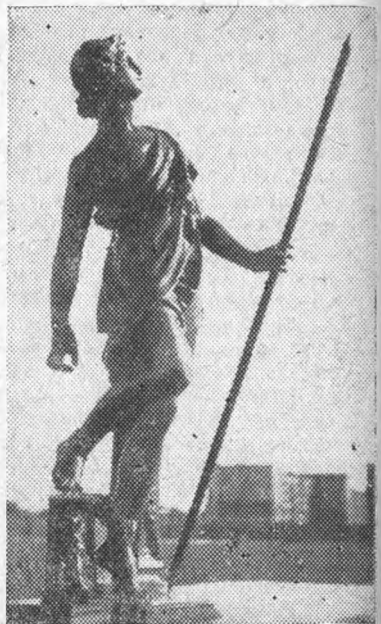
Переходящий приз по футболу, выигранный командой механического факультета