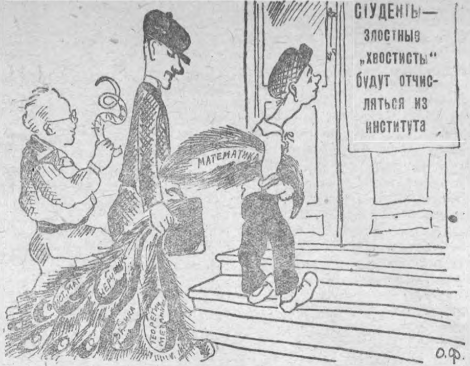
М-м, да... Придется „хвостичи“ все же ликвидировать, иначе...