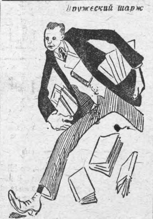
С. Берестов готовится к глубокой поработке лекции

— Прежде всего я должен сказать, что внимательно и активно прослушанная лекция должна быть основой понимания и усвоения курса. Я делаю особое ударение на внимательном прослушивании лекции.