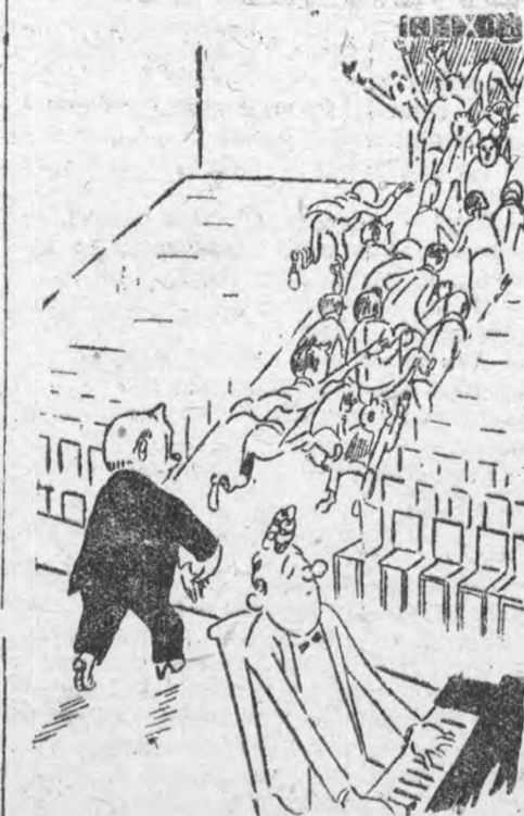
Куда, куда вы удалились..

ров певня и слова. Набор артистов — не случайный подбор имен. Институт добивается через этих мастеров вне-