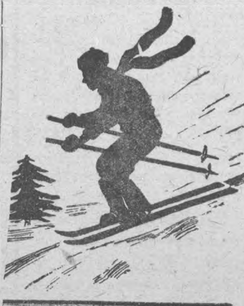
Главный „зачет“ во время каникул

Типография им. Володарского Ленинград, 125, Фонтанка, 57