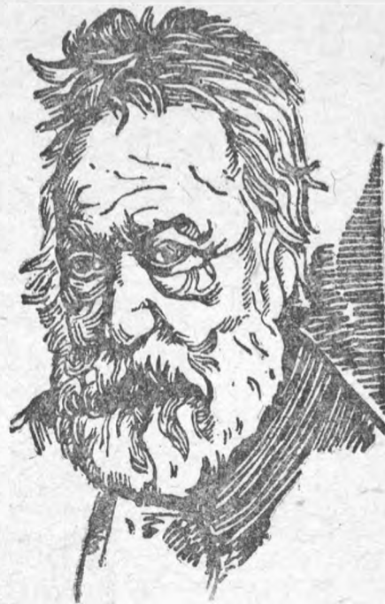
22 мая исполнилось 50 лет со дня смерти гениального французского писателя-романтика Винтора ГЮГО