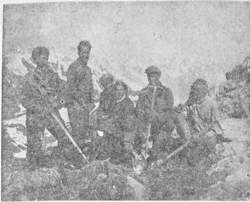
Отдых альпинистов в горах Кавказа

Г ОРЯЧО приветствую инициативу редакции «Индустриального» по популяризации альпинизма среди студентов и преподавателей ЛИИ. В качестве активного отдыха после напряженной умственной работы — альпинизм, по моему глубокому убеждению, не имеет себе равных. Бесспорно также его воспитательное значение в выработке смелости, выдержки, находчивости и чувства товарищеской солидарности. В условиях советского Кавказа — это одновременно источник разнообразных новых впечатлений, расширяющих умственный кругозор.