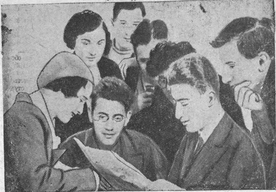
Студ. ОТФ, гр. 231, коллективно читают в «Правде» статью «Ищи бюрократа»