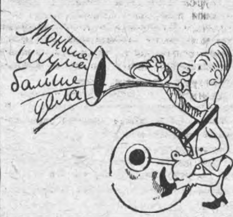
Слова и дела комитета КСМ ОТФ

ОТФ имеет дело с новым набором, на ОТФ проходят комсомольскую школу будущие кадры всех наших специальных факультетов.