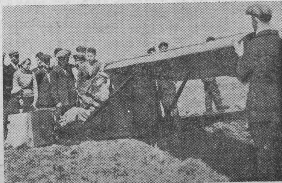
На занятиях планерного кружка