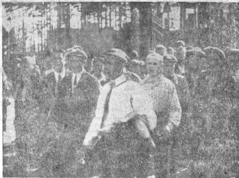
1 сентября уже с 8 час. утра в воротах института было тесно...