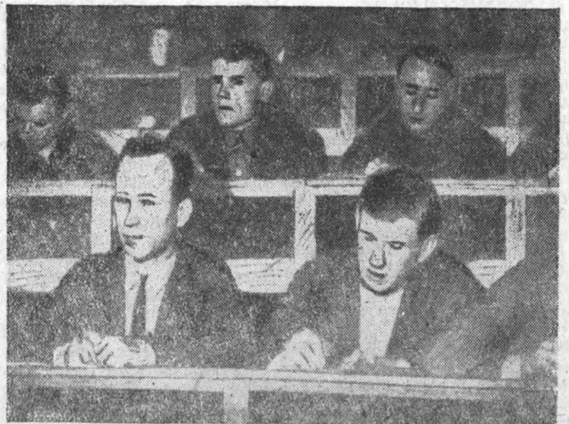
В первый же день занятий нового учебного года все аудитории были заполнены отдохнувшей за лето молодежью.