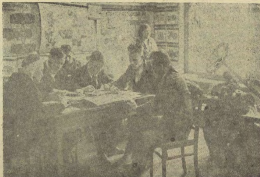
В кабинете авто тракторных машин

Наш ЗСК работает не очень хорошо. Точнее говоря — довольно плохо. И он находит на все причины. Так что, если студенту нужны ботинки, галоши, или, скажем, брюки стандартного фасона или другие товары более широкого потребления, лучше всего сесть на трамвай № 9 и поехать к проспекту 25-го Октября и поискать нужное в Гостином. Но есть и такие объективные причины, против которых бессильно даже руководство ЗСК например — веления природы. Эта самая природа велит скоропортящиеся предметы, как помидоры, огурцы, яблоки и прочие овощи продавать поскорее во избежание недоразумений.