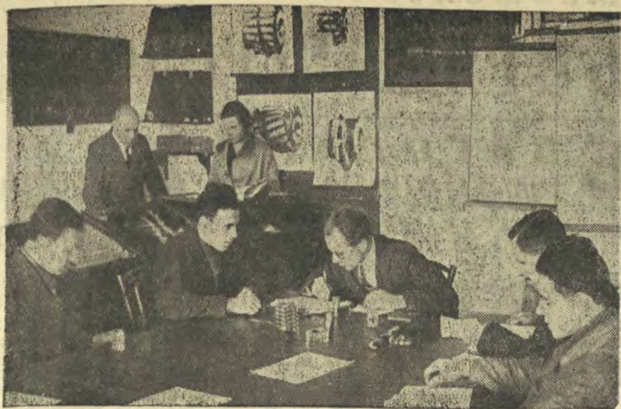
На консультации в кабинете резания