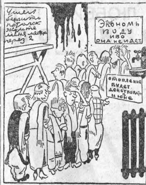
Обычная утренняя картина

В общежитиях студгородка по утрам студенты 10—20 минут стоят в очереди в уборных, так как выше третьего этажа лет воды. В чем дело? Почему в текстильном городке на Батениной, находящемся на той же магистральной водоснабжения, вода бывает в любое время на 7-м этаже?