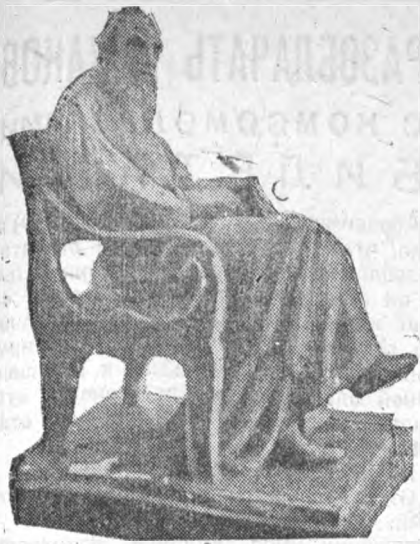
Скульптура Л. Толстого работы Гинзбурга, находящаяся в фундамент. б-ке ЛИИ.

В помещении Читального зала Фундаментальной библиотеки Общим факультетом и Фундаментальной библиотекой организуется большая выставка, посвященная Л. Н. Толстому по случаю 25-летия со дня его смерти.