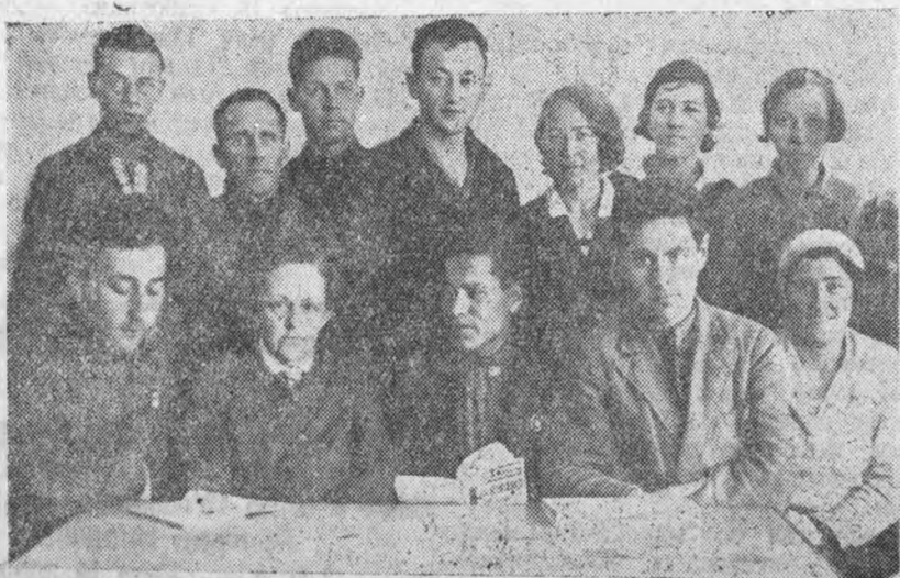
Кружок немецкой разговорной речи, организованный комсомолом ИЭФ