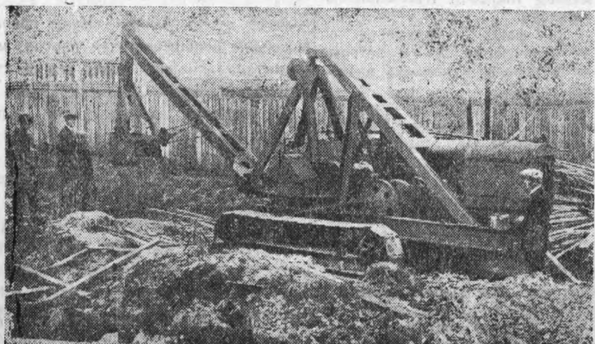
Наш экскаватор стоит под открытым небом