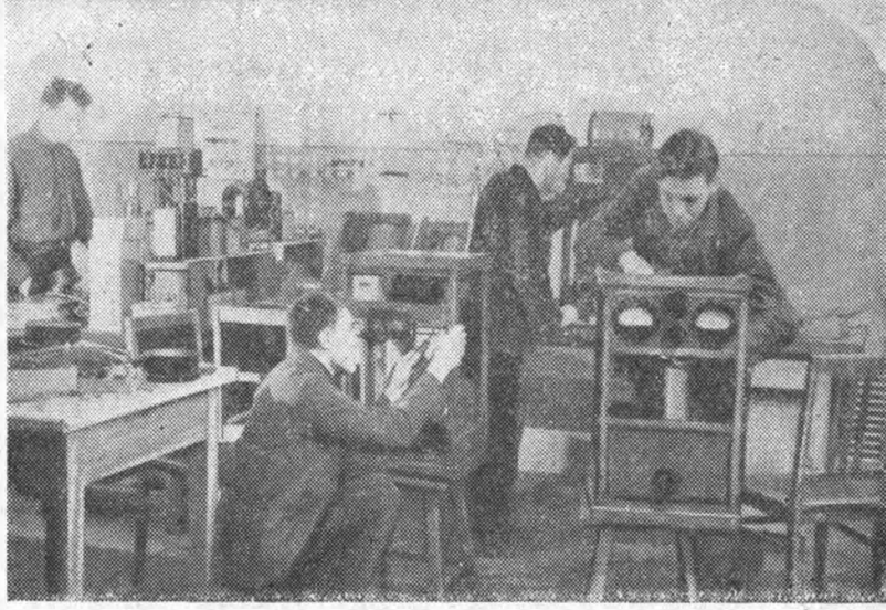
Студенты последних курсов ИФ специальности радиофизики монтируют лабораторию генераторов