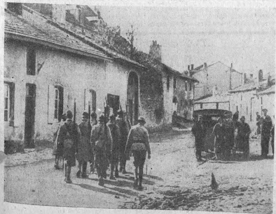
На снимке—патруль французских пограничников в селении близ Метца на франко-германской границе