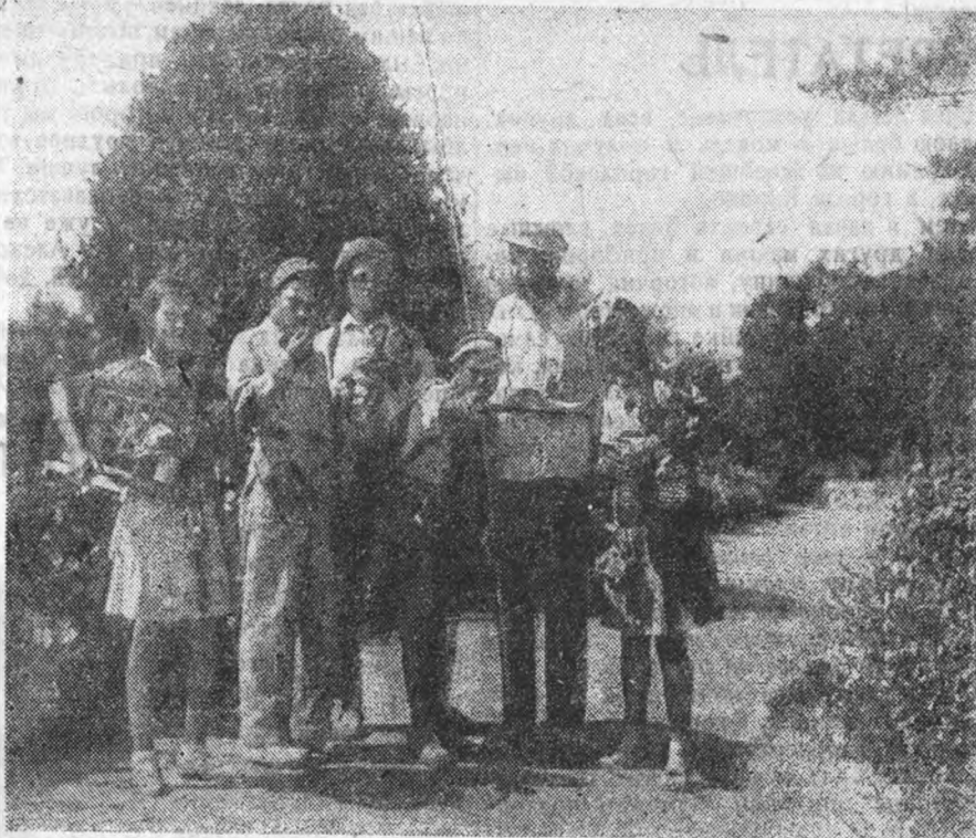
На днях на экранах Ленинграда будет показан новый художественный фильм „ЛЕНОЧКА И ВИНОГРАД“. На снимке — кадр из фильма

шесть часов в сутки, хотя совершенно очевидно, что фундаментальная библиотека должна быть открыта целый день.