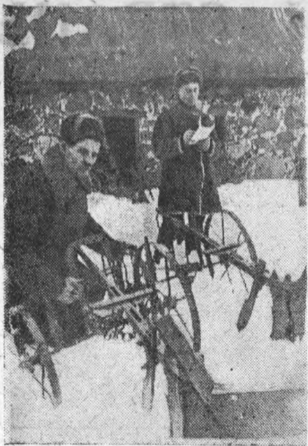
Колхоз „Трудовик“ Батецкого района к весенней посевной кампании закупил три двухпарных плуга, конные грабли, косилку и др. сельскохозяйственный инвентарь