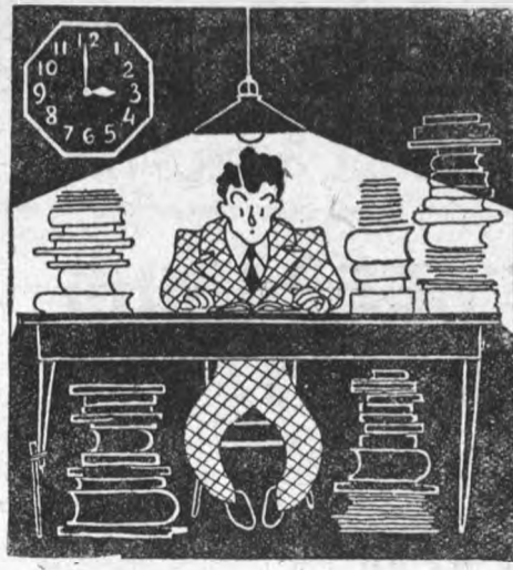
... Я как губка впитываю в себя формулы...