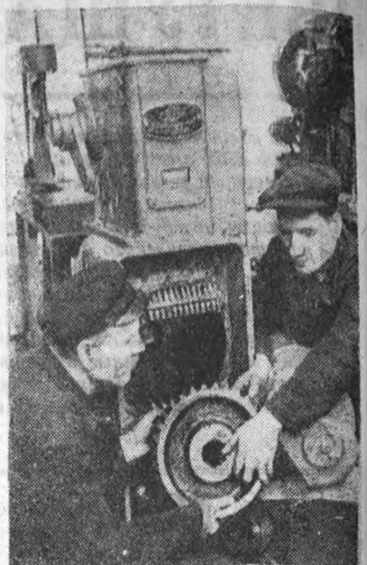
На заводе „Электроаппарат“ в экспериментальной мастерской заканчивается сборка инерционного привода для канала „Волга—Москва“. Этот привод освоен в СССР впервые