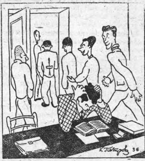
... Студенты шумно выходят в коридор...