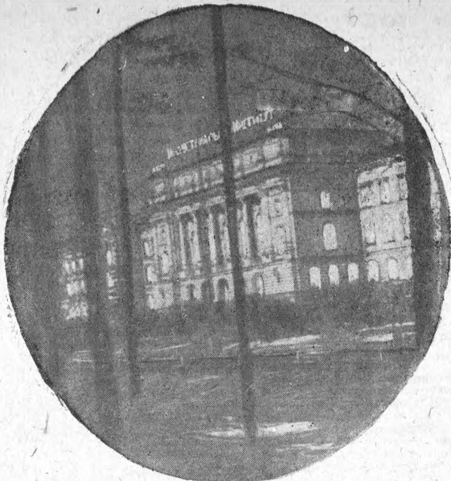
ГЛАВНОЕ ЗДАНИЕ ИНСТИТУТА НОЧЬЮ...

ЛИИ—МММИ: 1. Кf3; d5. 2. c4, d:c4. 3. Кa3; c5; 4. К:c4. МММИ—ЛИИ: 1. e4, c5. 2. Кf3, Кc6. 3. d4, d:c; 4. К:c4.