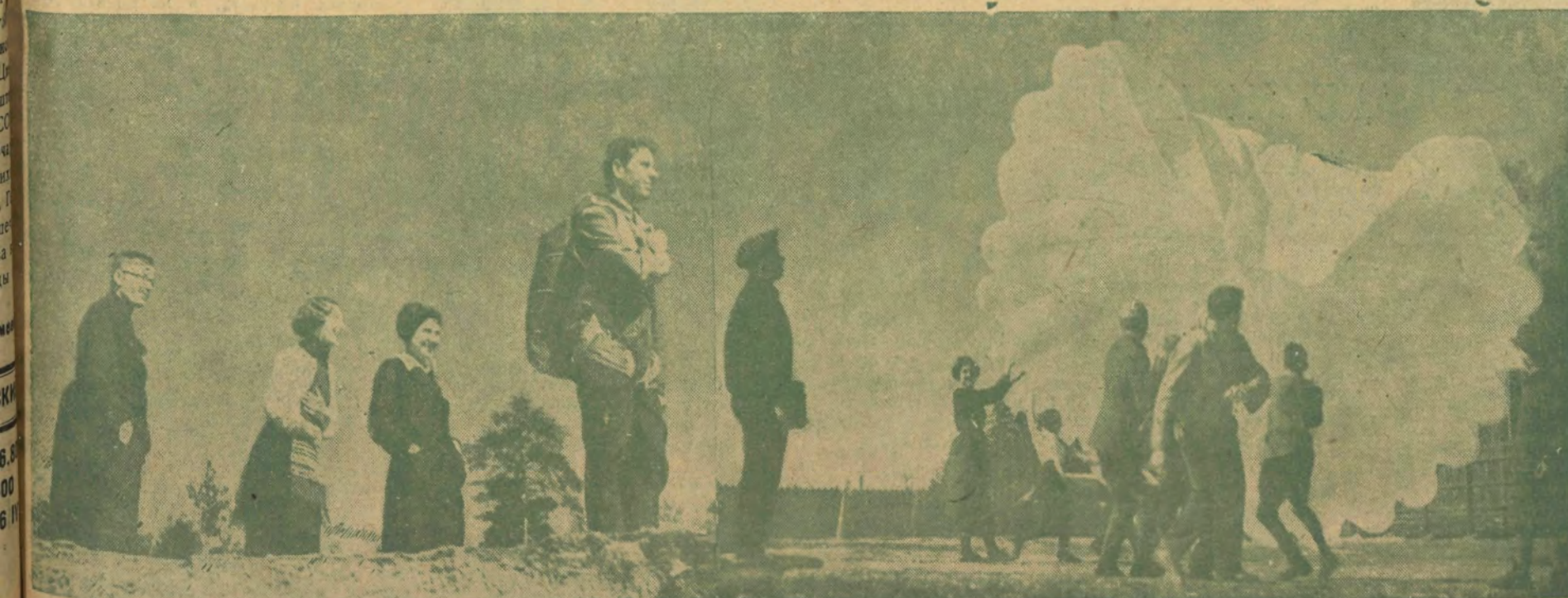
На практических занятиях команды парашютистов ЛИИ