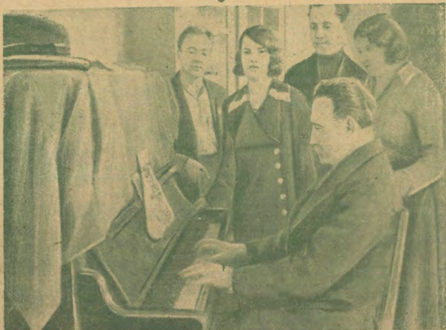
Занятия в вокальном кружке 6-го корпуса студгородка по постановке голоса