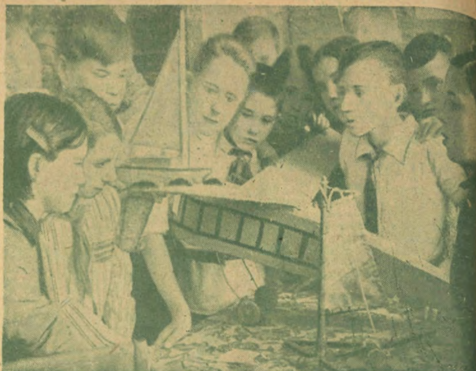
Пионеры у своих подарков X съезду ленинского комсомола