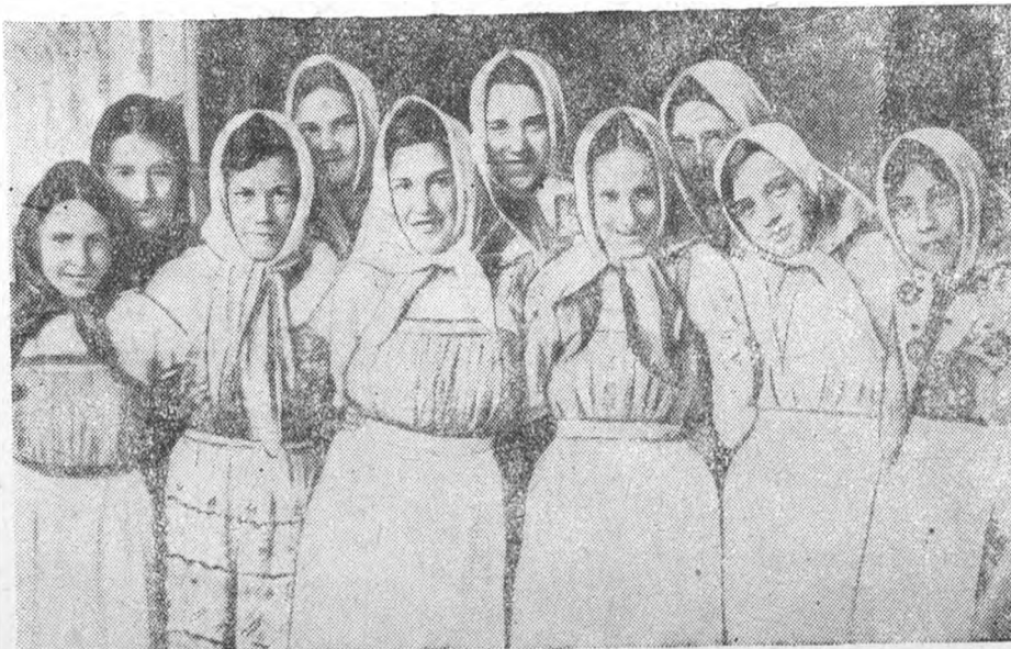
Дети научных работников, выступавшие на вечере самодеятельности 29 мая