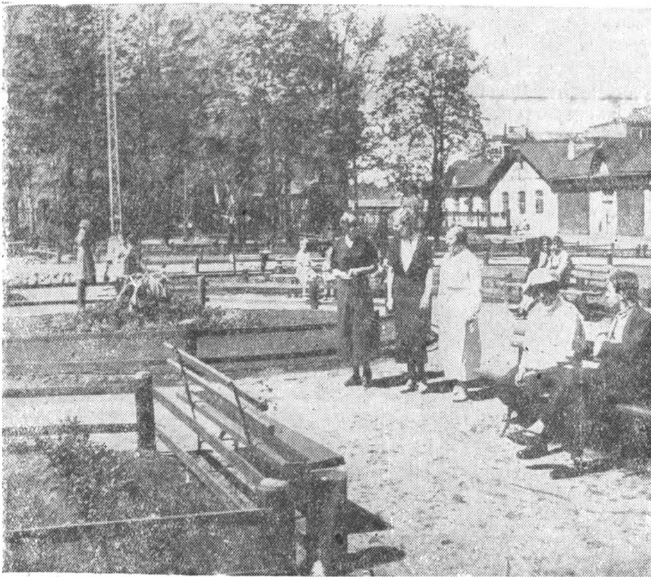
Перед первым общежитием разбит новый сквер

— Послали туда работать. — Ах, вот что,—протянул тот и безнадежно свистнул.—Да, братец, поработаешь там.