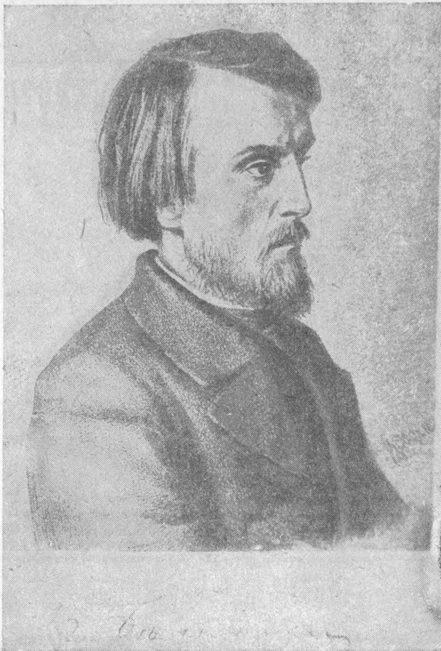
11 июня сего года исполнилось 125 лет со дня рождения критика-публициста В. Г. БЕЛИНСКОГО

И Тургенев, из прекрасного далека полемизируя с шедшей под знаменем Белинского молодой революционной Россией, в своем „Довольно“ всенародно заявил, что „Венера Милосская выше принципов 93-го года“. И Гончаров, благонамеренный и осторожный, уже при первой встрече был опален революционным жаром, который рассеивал вокруг себя неистовый Виссарион, и счел за благо посторониться. „Мне было страшно“,—говорит Гончаров о своих первых встречах с Белинским.