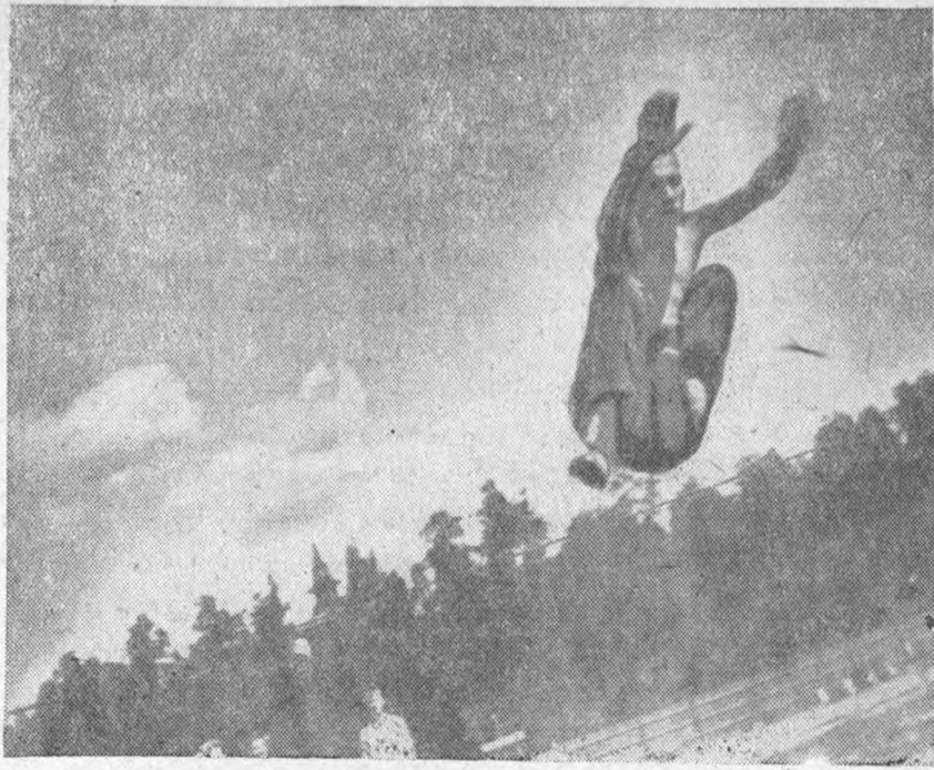
На снимке—прыжок в высоту