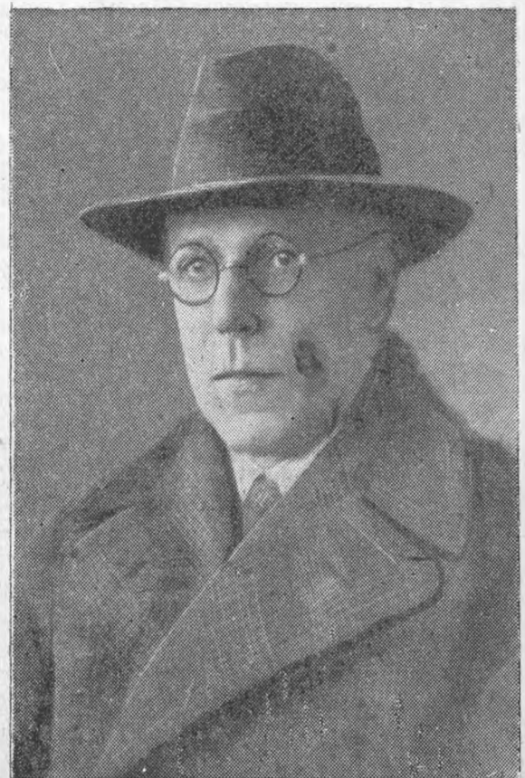
Докладчик на научно-технической конференции студентов ИФФ—проф. Н. Н. ДАВИДЕНКОВ