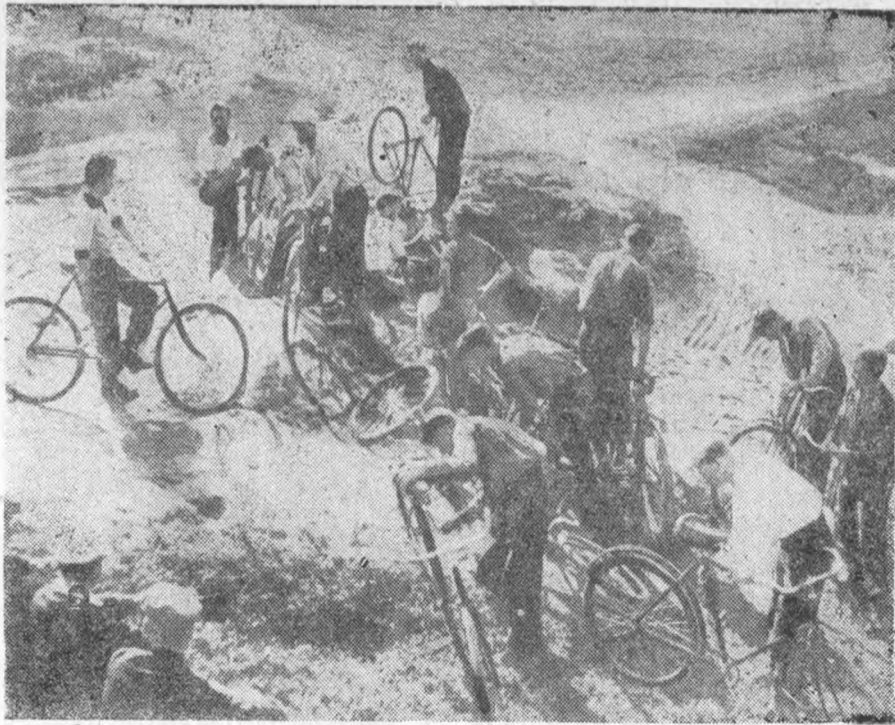
Группа участников вело-пробега на тренировке

строек, интересующих каждого гражданина нашей великой родины. 52 дня в тесном контакте с лучшими друзьями — солнцем, воздухом и водой — дадут хорошую закалку для предстоящих «боев» в новом учебном году.