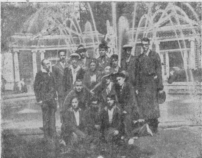
Группа студентов на отдыхе