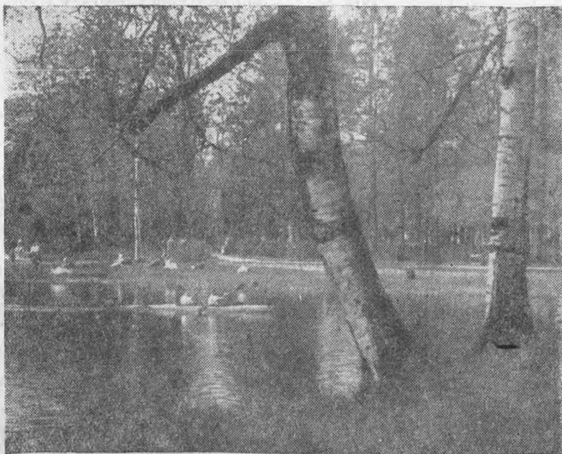
На снимке — студенты на отдыхе в Павловске