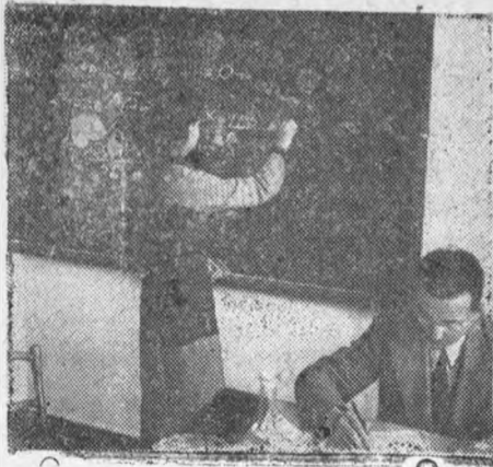
На приемных испытаниях