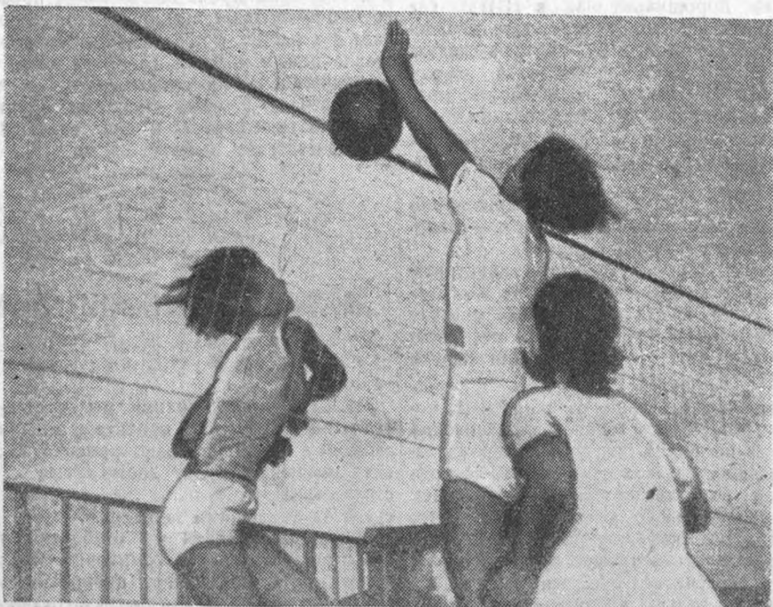
Женская волейбольная команда ЛИИ заняла 2-е место на спартакиаде, проиграв только Московскому механико-машиностроительному ин-ту. На снимке—момент игры

Просьба к работникам по печати прийти не позднее 2 сентября в I корпус, 2-й этаж, комнату 1 за получением разверстки на газеты.