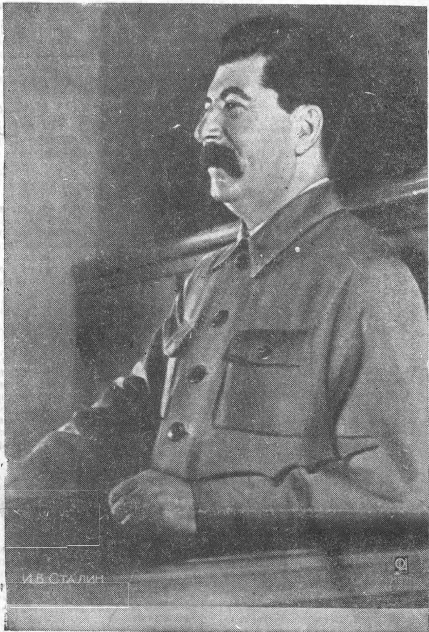
И. В. Сталин

Отдадим все наши силы, все пламя нашей молодости великому делу коммунизма!