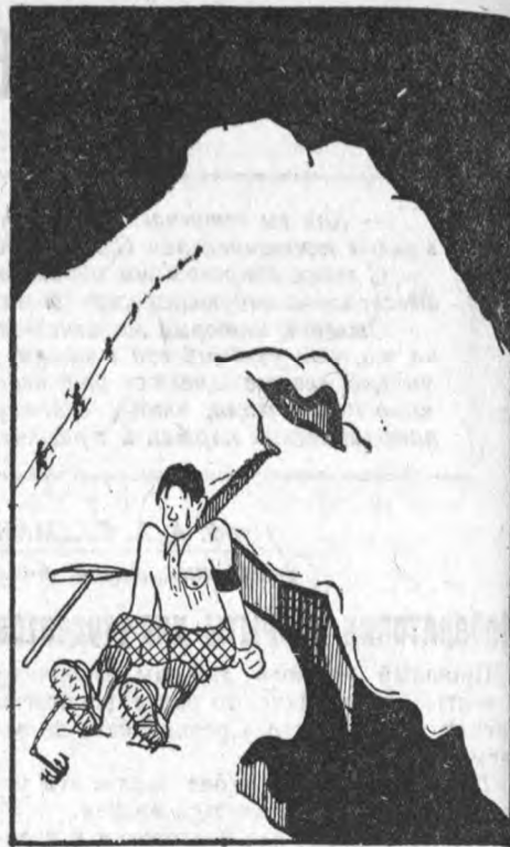
Куда идти? Вверх—страшно, а вниз—еще хуже. Посижу-ка я здесь... придут—все равно расскажут