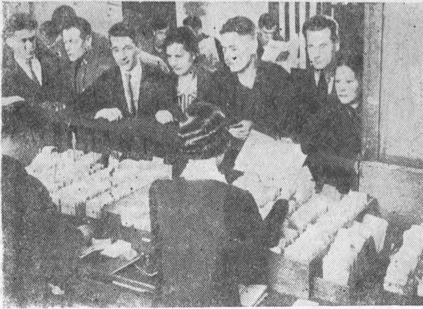
1 сентября с утра открылись библиотеки, а к вечеру в редакцию поступила масса жалоб на скверную организацию их работы. На снимке—очередь в фундаментальной библиотеке ЛИИ (в других тоже не лучше)