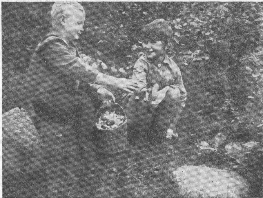
Дети студентов на даче в Елизаветино собирают грибы