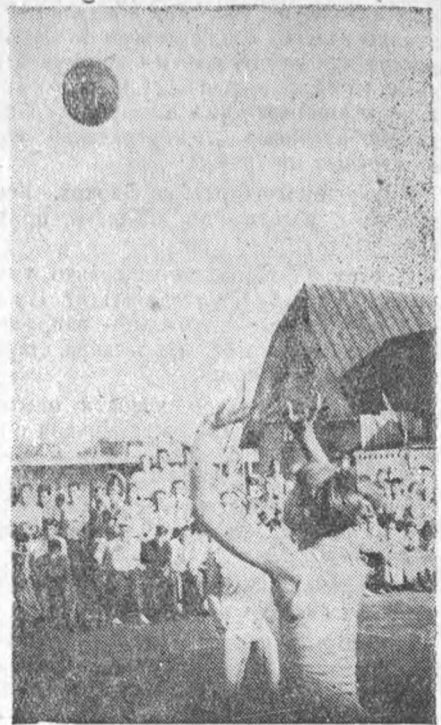
Момент игры в волейбол