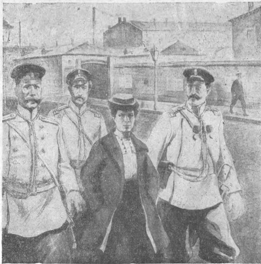
В Музее Революции открыты новые залы, дополняющие отдел „Революция 1906—1907 гг.“. На снимке—картина художника Жилина—„Арест М. И. Ульяновой в Петербурге в 1906 г.“.