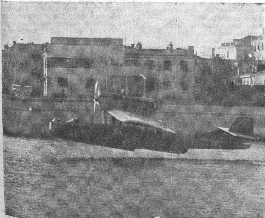
30 сентября Герой Советского Союза В. С. Молоков вылетел из Москвы в Красноярск. На снимке — самолет тов. Молокова — СССР-Н2 садится 19 сентября на Москва-реке, закончив грандиозный арктический перелет, протяженностью 26.300 км.