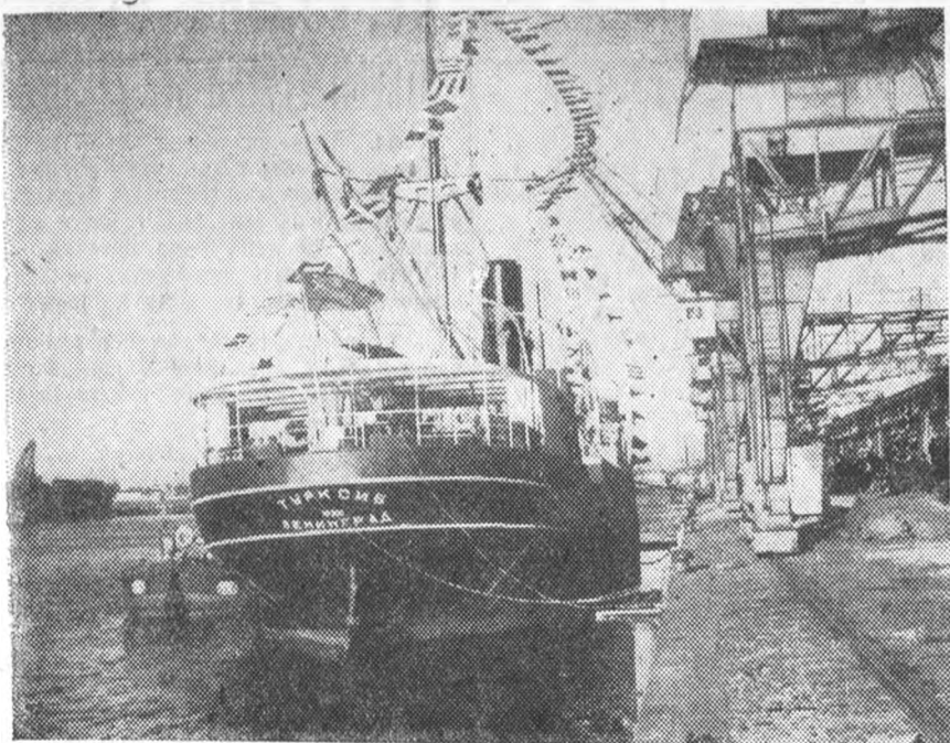
21 октября из Ленинградского торгового порта ушел пароход „Турксиб“ с продовольствием и одеждой для героических женщин и детей Испании. На снимке—пароход „Турксиб“ перед выходом из Ленторгпорта