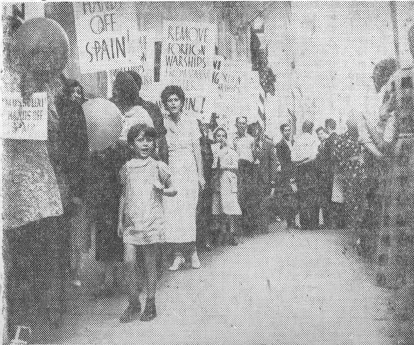
На снимке—демонстрация протеста американских рабочих у здания итальянского консульства в Нью-Йорке. Надписи (слева направо): „Муссолини, руки прочь от Испании“, „Руки прочь от Испании“ и т. д.