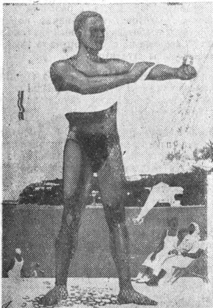
ВАНДАНА СССР ИМЕЮТ ПРАВО НА ОТДЫХ

К XIX годовщине Великой Пролетарской Революции Изогиз выпускает серию художественных плакатов, в большинстве своем посвященных проекту сталинской Конституции. Первые четыре плаката—„Право на труд“, „Право на образование“, „Право на отдых“ и „Счастливые родятся под советской звездой“ уже вышли из печати.