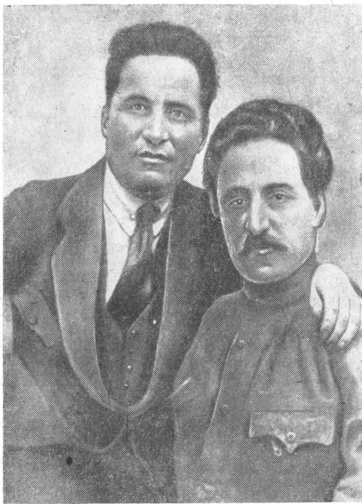
С. М. Киров и Г. К. Орджоникидзе