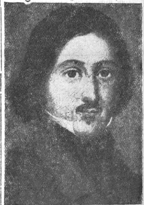
На снимке—экспонат выставки портрет Н. В. Гоголя—репродукция с подлинника картины великого украинского поэта Тараса Шевченко (масло)

К открытию в Москве выставки музейных фондов в Государственном историческом музее