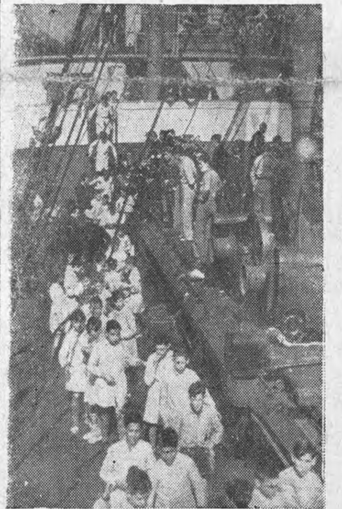
Школьники Барселоны на борту „Зырянна“