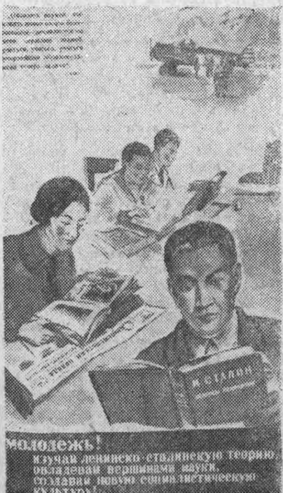
Новый плакат Изогиза „Молодежь изучает ленинско-Сталинскую теорию“, работы художника Голяховского

Пленум ЦК ВЛКСМ поставил перед вузовскими организациями комсомола требование „добиться серьезного улучшения всей работы по политическому воспитанию студенческой молодежи“. Конференция комсомола должна определить конкретные пути этого подъема воспитательной работы в институте. Политическое воспитание, проверка качества работы политкружков, подбор и руководство пропагандистами—должны стать повседневной заботой и задачей каждого члена комитета и активиста комсомола.