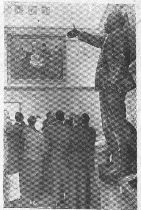
В связи с приближением XIX годовщины Великой пролетарской революции наблюдается большой наплыв экскурсий в музей В. И. Ленина. Особой популярностью пользуются отряды, отражающие деятельность В. И. ЛЕНИНА и товарища СТАЛИНА перед Октябрем и во время Октября. На снимке—экскурсанты в зале № 9

(вернее, ее руководители) не подумала о том, что выговор можно и нужно снять. Приведенные примеры подтверждают высказанное раньше положение. И чем скорее наши факультетские организации научатся правильно реагировать на поступки своих членов, тем скорее они подымут работу ВЛКСМ на тот уровень, которого требует от комсомола партия.