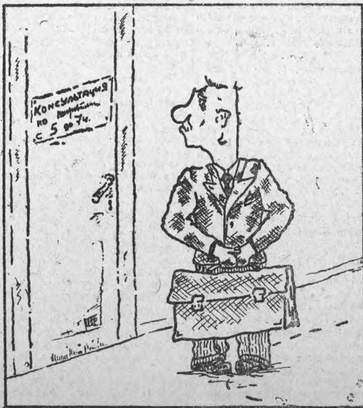
Студент — к сожалению я в эти часы занят