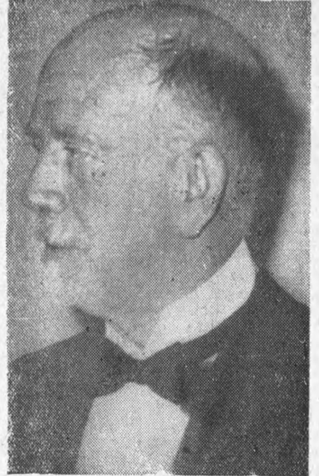
На снимке—Пио Бароха антифашистский писатель новеллист