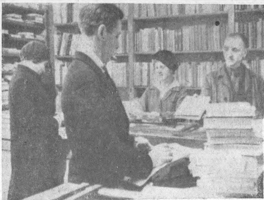
В киоске КУБУЧА (Главное здание)