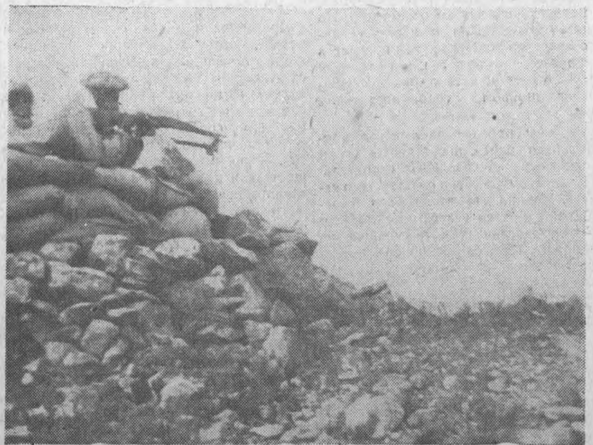
Бойцы правительственных войск обстреливают позиции мятежников в секторе Тэрзуэль