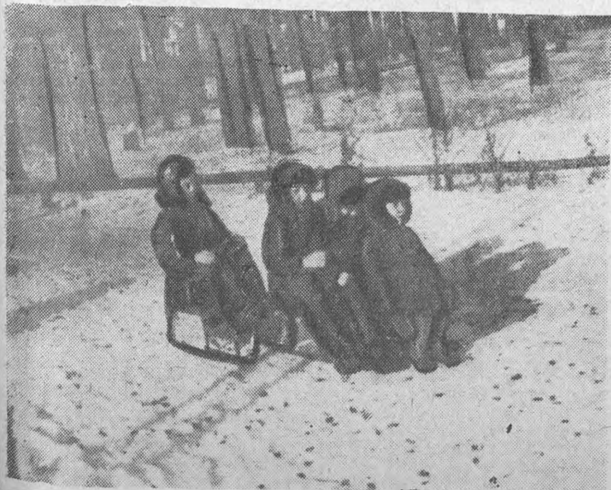
По первому снегу