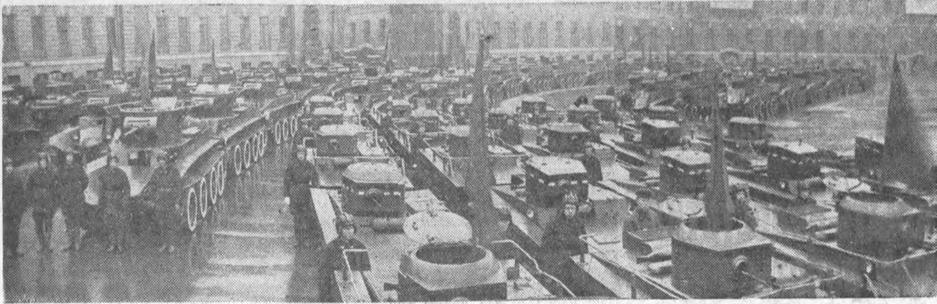
Танки на площади Урицкого перед парадом