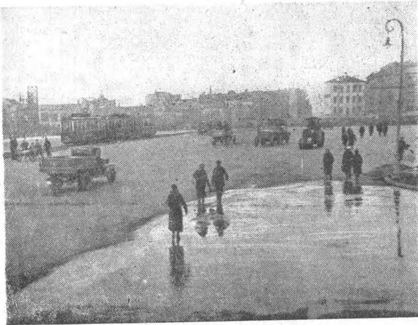
На месте снесенных Московских ворот создана большая асфальтированная площадь