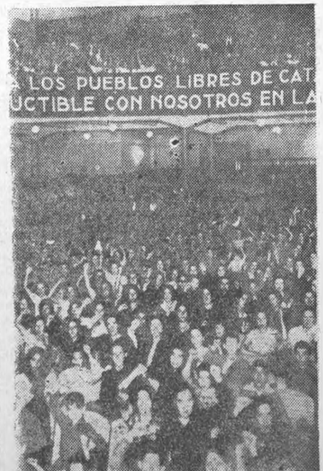
Митинг компартии, состоявшийся в конце октября в зале Монументаль в Мадриде