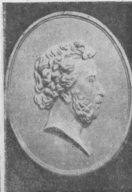
Фарфоровый завод им. Ломоносова выпустил фарфоровый барельеф Пушкина по скульптуре неизвестного скульптора На снимке—барельеф ПУШКИНА