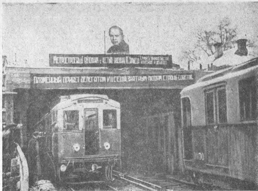
27 ноября со станции московского метрополитена „Смоленская площадь“ вышли первые поезда для испытания метромоста под нагрузкой. На снимке—выход поезда из тоннеля на эстакаду метромоста

От редакции. Статья т. А. М ставит чрезвычайно наболевший у студенчества вопрос о нагрузке рабочего времени, о использовании дня для проработки и т. д. Мы приглашаем высказаться по этому поводу деканов, профессоров, преподавателей и студентов.