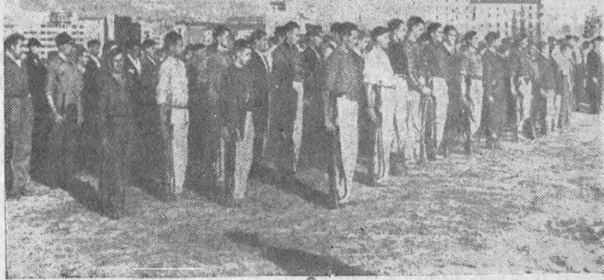
Военное обучение молодых басков—бойцов правительственных войск в окрестностях Бильбао