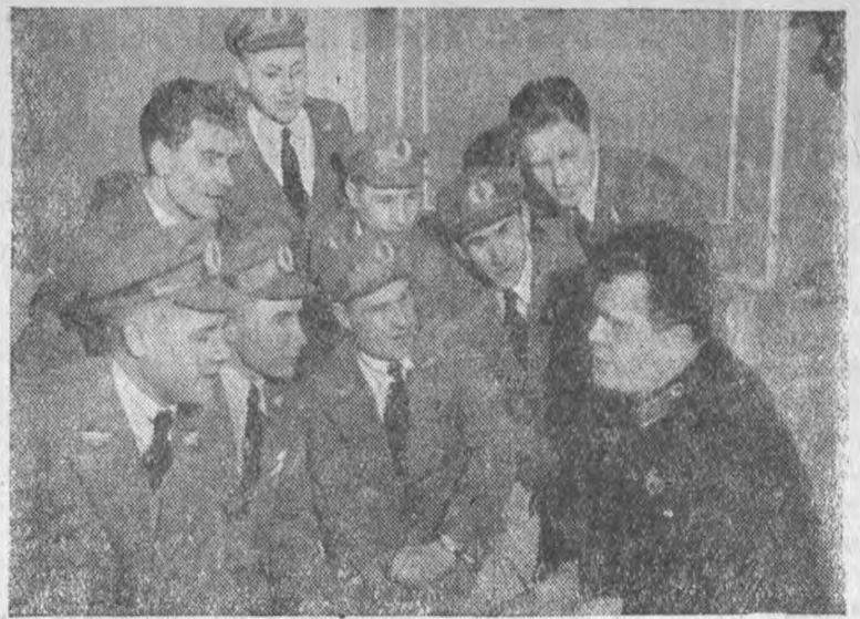
11 декабря в Москве в Колонном зале Дома Союзов состоялась вечер выпускников центрального аэроклуба им. Косарева, научившихся без отрыва от производства управлять самолетом, парить на планере, прыгать с парашютом.