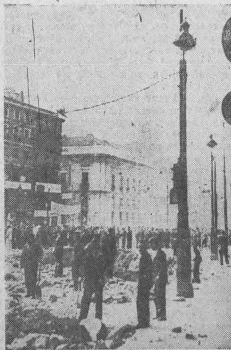
Вид площади Пуэрта-дель-Соль в Мадриде после налета фашистской авиации. На заднем плане здание министерства внутренних дел